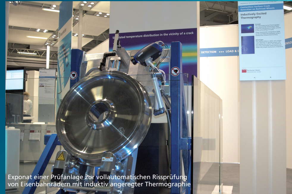
Exponat einer Prüfanlage zur vollautomatischen Rissprüfung von Eisenbahnrädern mit induktiv angeregter Thermographie

Sensor- und Datensysteme für Sicherheit, Nachhaltigkeit und Effizienz